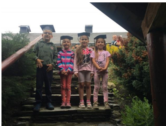
Naši předškoláci ☺

Při letošním vystoupení pro maminky a tatínky jsme se vrátili do ledové zimy. Děti zahrály rodičům divadelní představení Ledové království. Po vystoupení jsme si s dětmi užili přenocování ve školce i s hledáním pokladu.